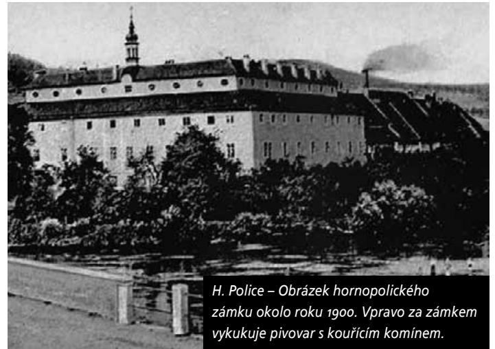
H. Police – Obrázek hornopolického zámku okolo roku 1900. Vpravo za zámek vyukuje pivovar s kouřícím komínem.