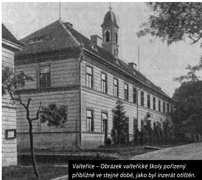
Valteřice – Obrázek valteřické školy pořízený přibližně ve stejné době, jako byl inzerát otištěn.