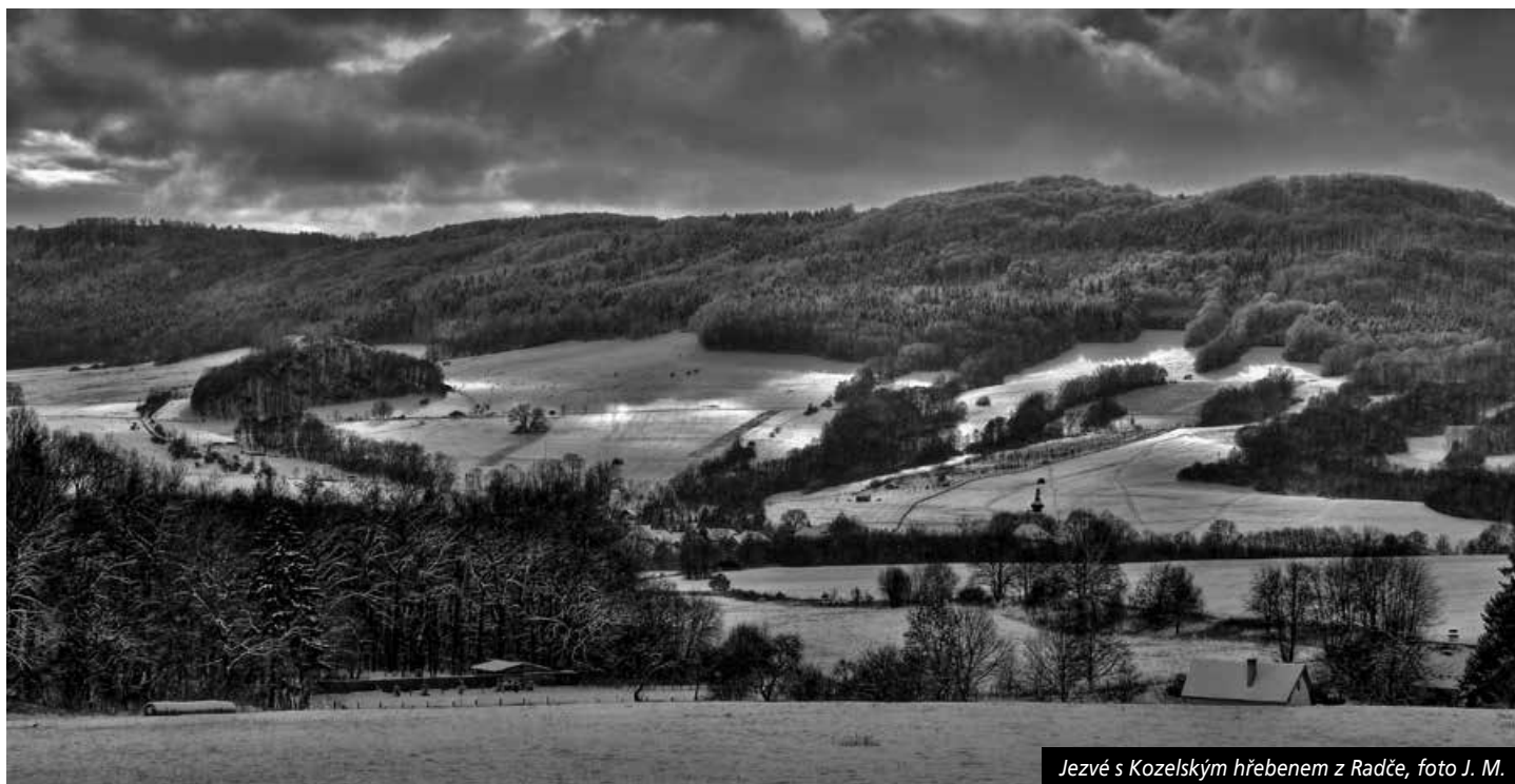
Jezvė s Kozelským hřebenem z Radče