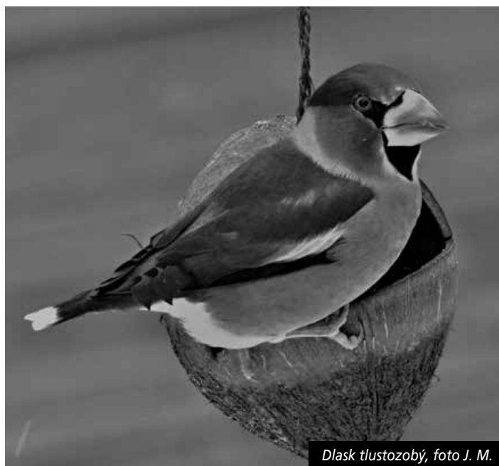
Dlask tlustozobý