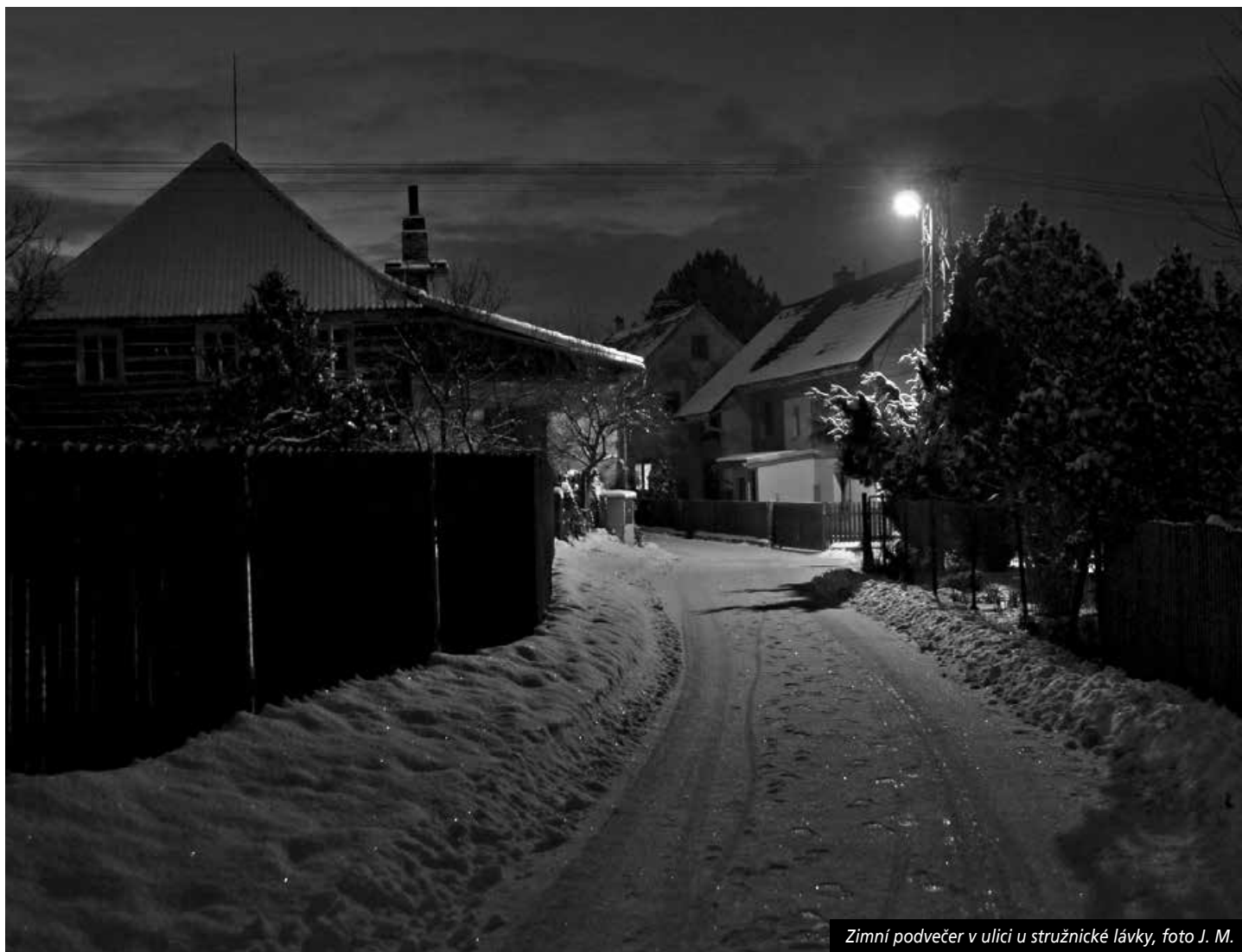
Zimní podvečer v ulici u stružnické lávky