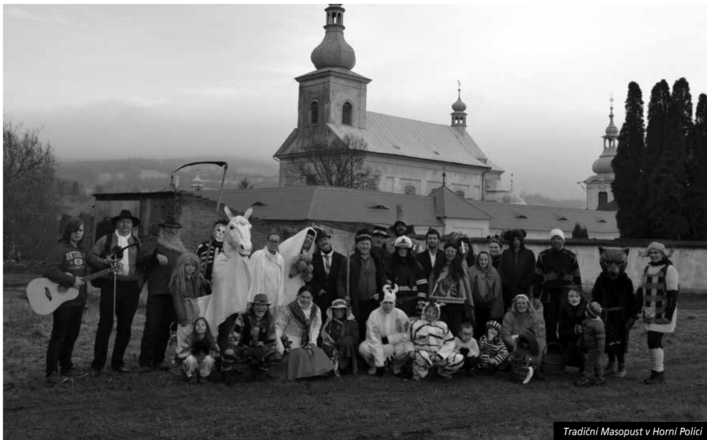
Tradiční Masopust v Horní Polci