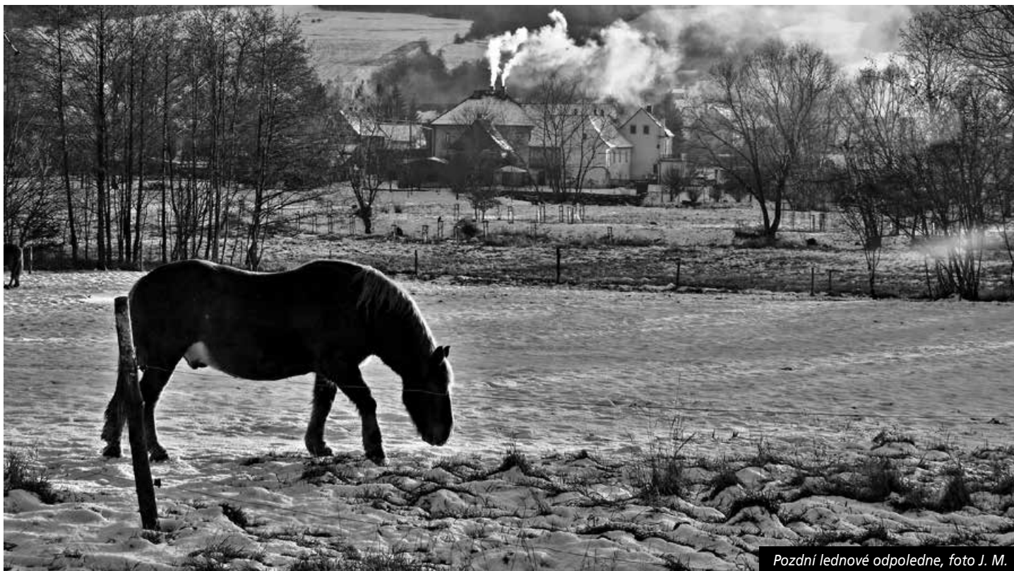
Pozdní lednové odpoledne