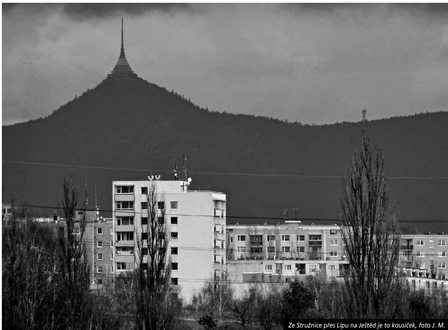
Ze Stružnice přes Lípu na Ještěd je to kousíček