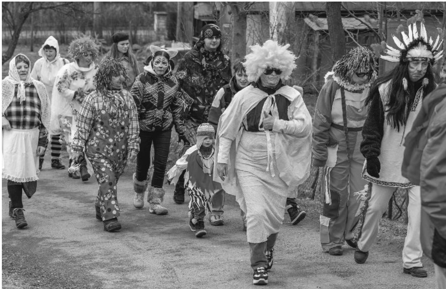
Masopustní průvod jdoucí Stružnicí.