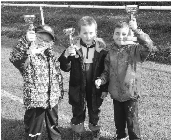
Pohár předsedy severočeského územního svazu