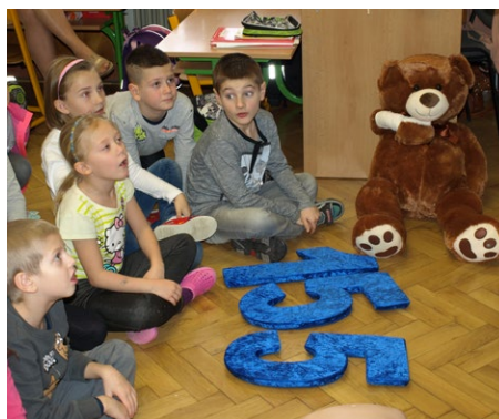
Medvědí kamarád pomáhá učit děti první pomoc

žáci byli proškoleni na ZŠ Liberec, U školy, se kterou záchranná služba na podobných projektech dlouhodobě spolupracuje. Délka