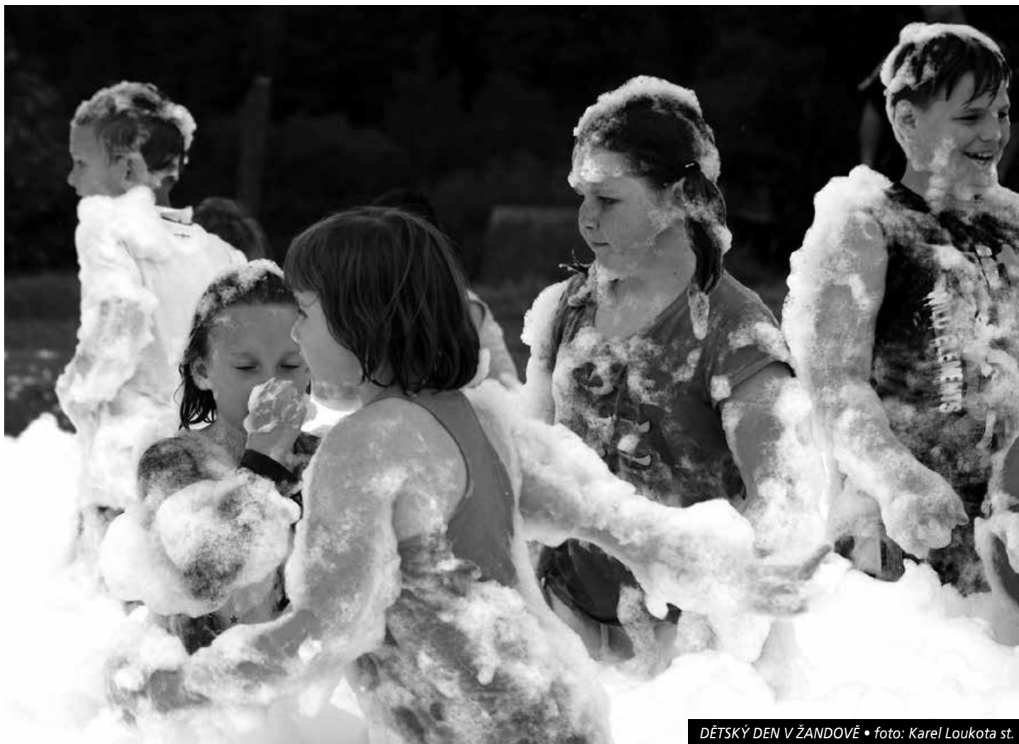
DĚTSKÝ DEN V ŽANDOVĚ